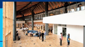
Library and Work Commons